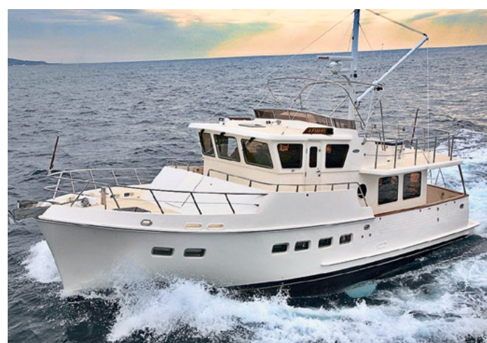
На странице слева: Яхты Selene у причала.