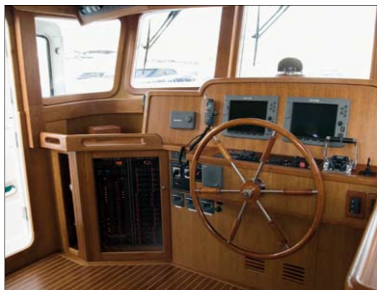
Le poste de pilotage est bien équipé. En mer, le navire est souvent sous pilote automatique.

Ce comportement est lié à la carène à déplacement, dotée de sections rondes jusqu'au tiers arrière, évoluant vers des formes semi-planantes destinées à limiter la tendance naturelle au roulis. La quille longue commence au brion et se poursuit jusqu'à l'arrière pour intégrer l'arbre d'hélice et la grosse quatre pales de 76 cm de diamètre, protégée par une cage formée par l'étambot et le gouvernail tenu par une forte crapaudine. Au-dessus de la flottaison, le franc-bord est généreux avec, à l'avant, une étrave puissante, volumineuse et très défendue, qui empêche l'enfourne-