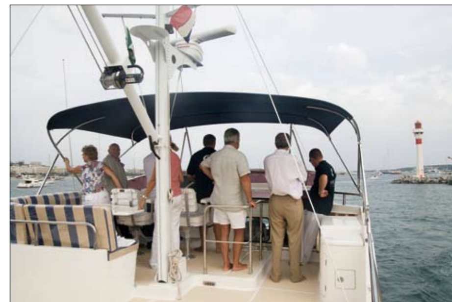
Sur le fly, la zone de vie, avec le carré et le poste de pilotage, occupe une petite partie seulement de la surface disponible.