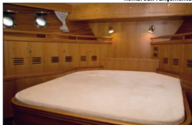
La cabine passagers est installée à l'avant et bénéficie de très nombreux rangements.