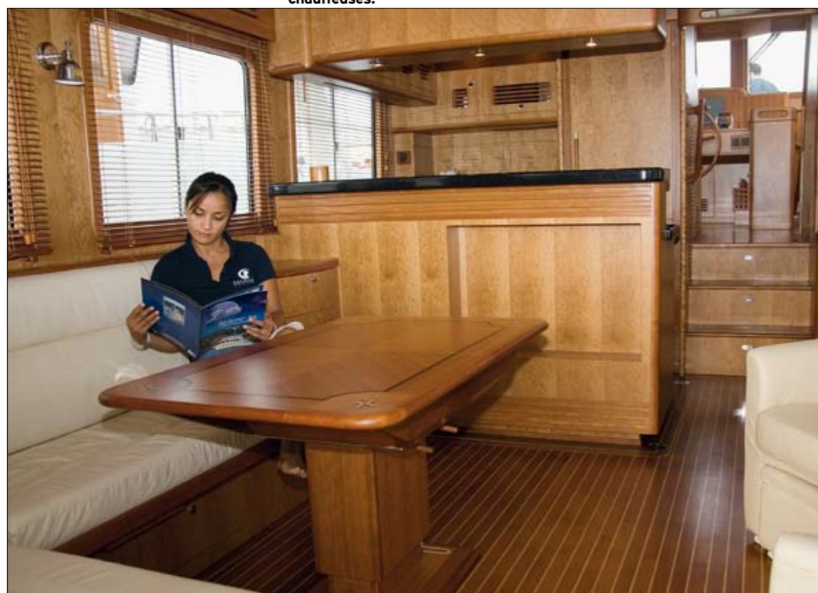
Le carré/salle à manger comporte une table réglable et un beau canapé en L, en vis à vis de deux chauffesses.