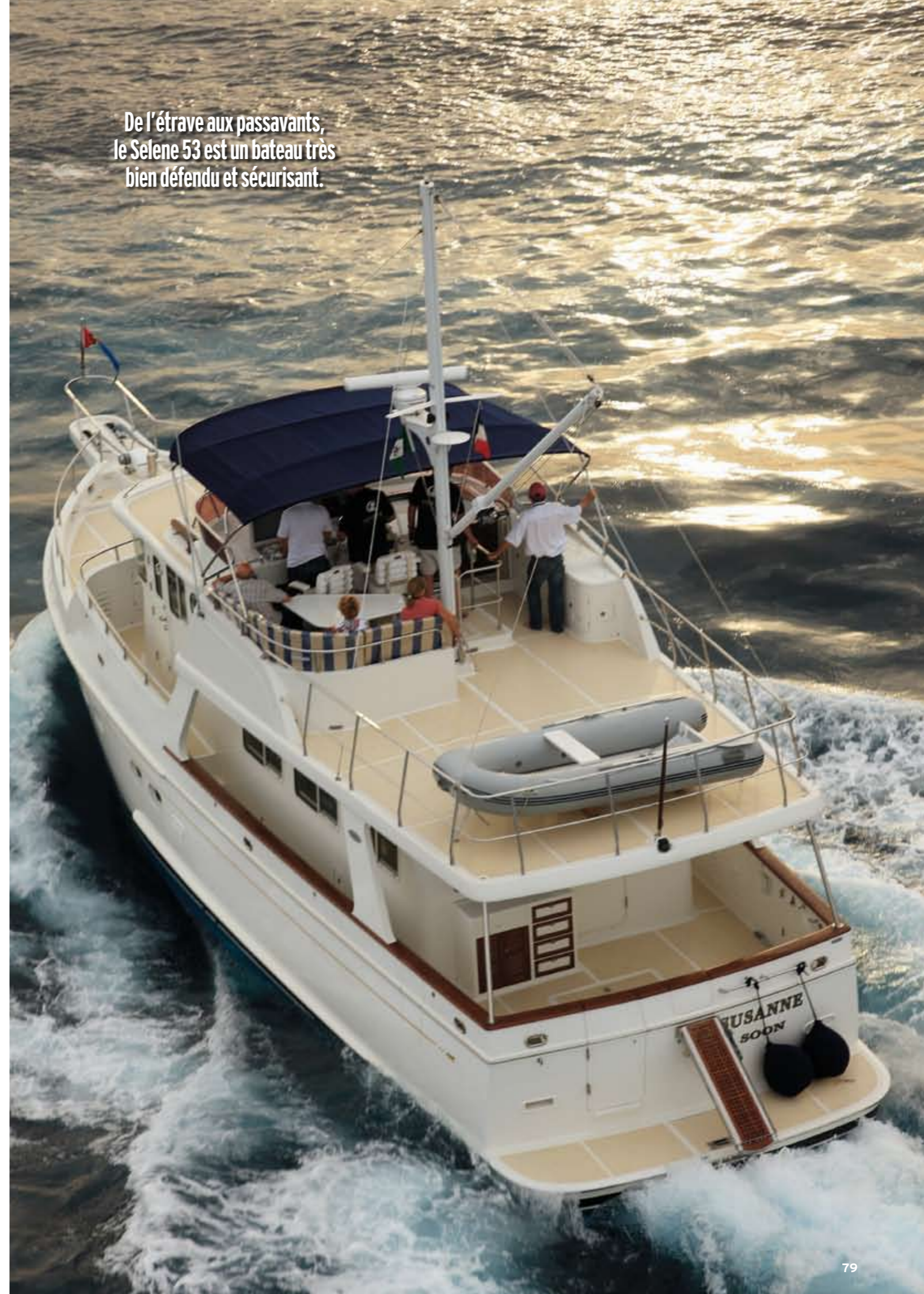
De l'étrave aux passavants, le Selene 53 est un bateau très bien défendu et sécurisant.