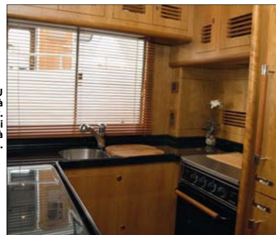
La cuisine en U est adaptée à la vie en mer. Elle est aussi complète qu'à la maison.