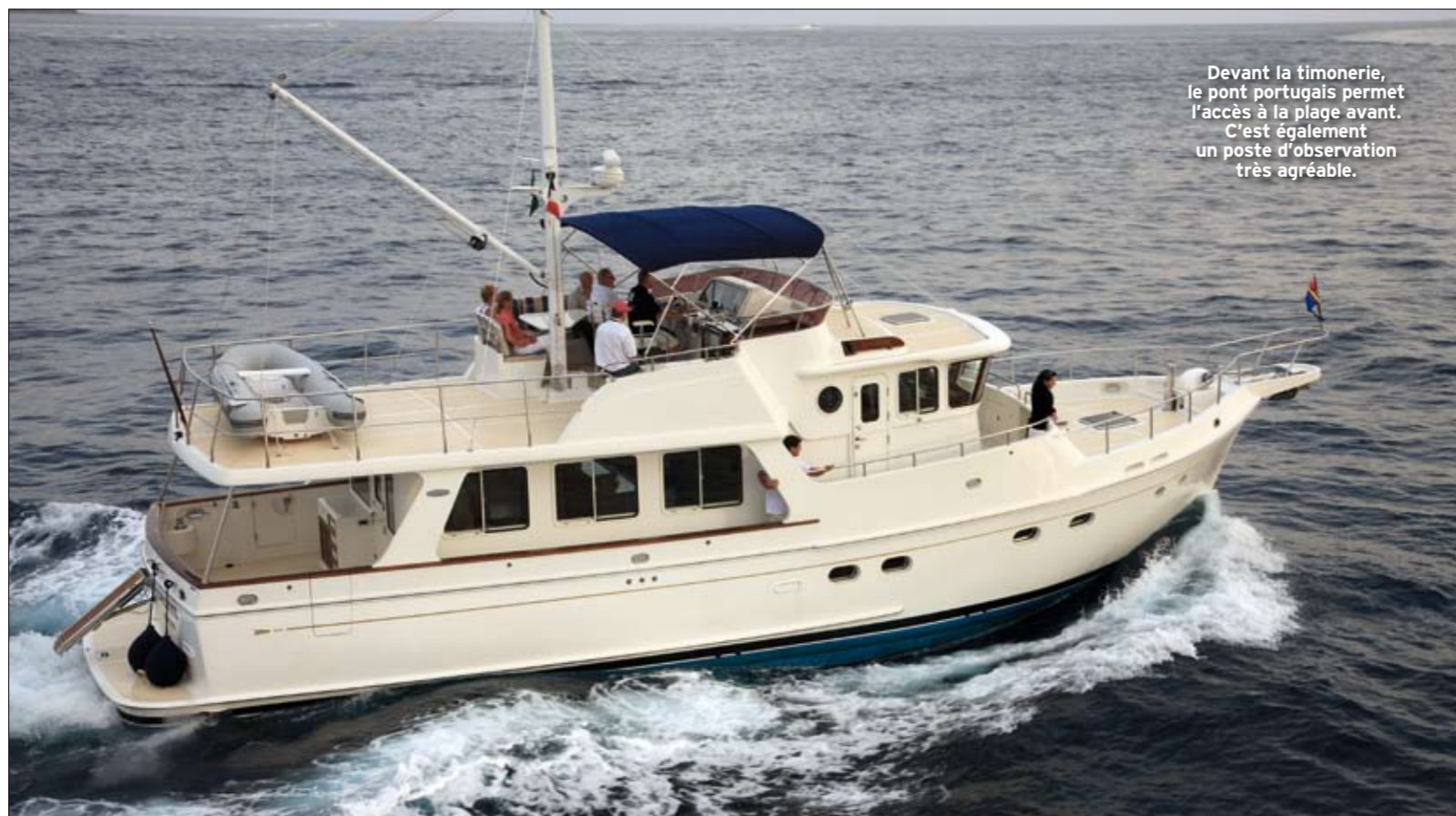
Devant la timonerie, le pont portugais permet l'accès à la plage avant. C'est également un poste d'observation très agréable.

La salle des machines se situe au centre du bateau, à peu près sous le carré, accessible par une porte au niveau des cabines. C'est un vaste espace parfaitement organisé pour le long cours avec une hauteur sous barrots et beaucoup de place pour évoluer autour du moteur et des différents systèmes mécaniques. Si la moitié arrière est réservée aux machines, les cabines occupent l'avant avec un choix d'aménagement de deux ou trois cabines. Celle du propriétaire est située au centre et prend toute la largeur de la coque. La salle de bains, dans la version deux cabines, correspond à l'espace dévolu à la troisième cabine, ce qui ménage