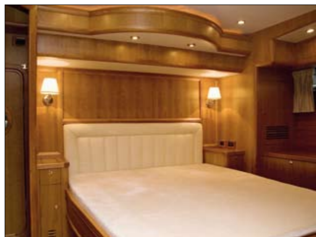
La cabine du propriétaire, habillée de teck, occupe toute la largeur de la coque, au centre du bateau.