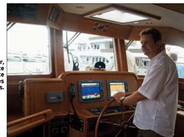
De l'intérieur, la vision du pilote est excellente grâce aux larges vitres inversées.